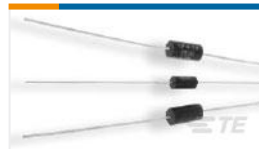
TE 零件编号1624323-3 UPW50 0.1% 5PPM 10K