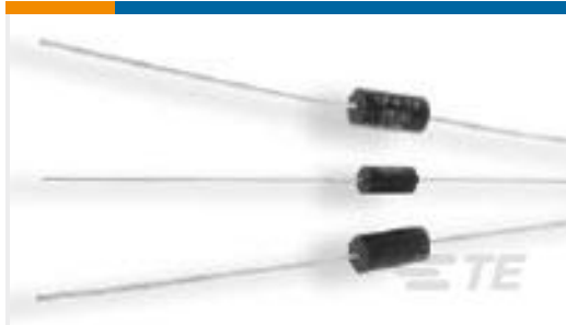
TE 零件编号1624323-7 UPW50 0.1% 5PPM 200R