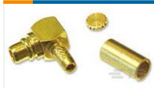
TE 零件编号1-1634003-0 MMCX R/A Plg Hex 50Ohm Gold RG178B/U, 19