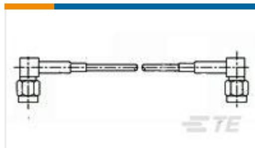
TE 零件编号1337812-3 50 OHM COAX SMA ELB PLUG ELB P