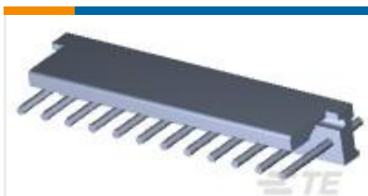
TE 零件编号4-641209-2 12P MTA156 HDR ASSY FL ST LF