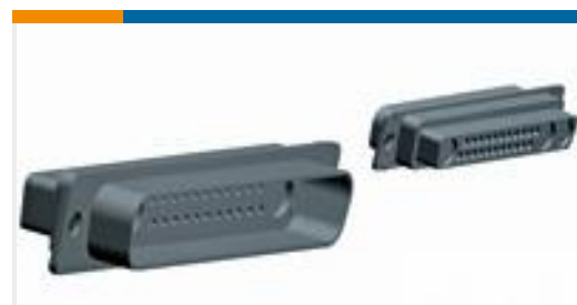
TE 零件编号208742-1 PLUG ASSY,COAX MIX, AMPLIMITE